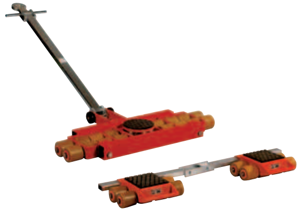
JL 12 K