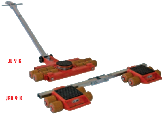
JL 9 K